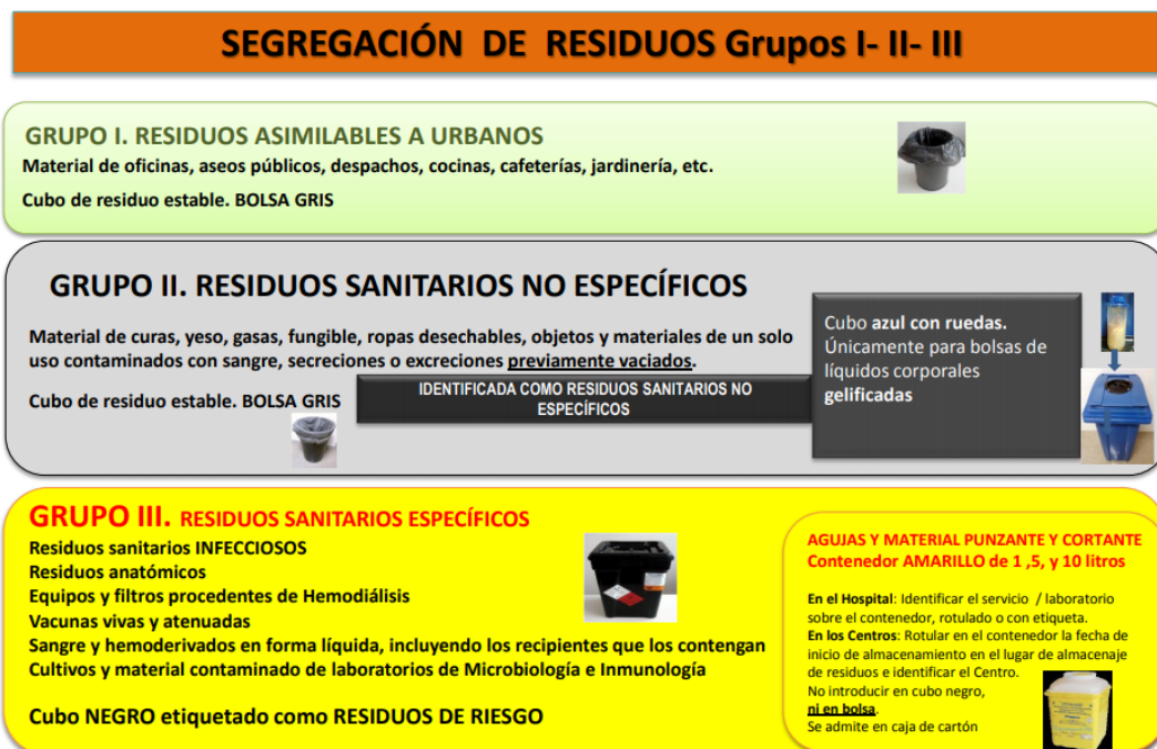
Figura 2. Resumen esquema de la segregación de Residuos Sólidos Grupos I, II y III.

Cada sala de cultivos se encuentra dotada de un cubo de residuos con bolsa gris (Grupo II: Residuos sanitarios no específicos, papel y cartón), un contenedor negro (Grupo III: Material contaminado con restos biológicos: placas, pipetas) y un contenedor amarillo de objetos punzantes (Pipetas Pasteur). Todos los contenedores deberán permanecer en su ubicación correspondiente siempre con la tapa cerrada, evitando la acumulación de residuos en cualquier otra área de la sala de cultivos. Una vez alcanzado el 80% de su capacidad máxima, los contenedores serán sellados por parte de los usuarios de las Salas o del Responsable de la Unidad de cultivos y se sacarán a la entrada para su reemplazo. Del mismo modo, en el almacén de la Unidad de cultivos hay disponibles bidones para residuos líquidos: Soluciones Acuosas, Líquidos halogenados (cloro) y Líquidos No halogenados. Cuando se alcancé el 80% de su capacidad máxima, estos bidones se cerrarán y se sacarán a la entrada de la unidad para su reemplazo por el personal del Hospital La Fe. En la Entrada de la Unidad se dispone también de un contenedor de color amarillo para los envases.